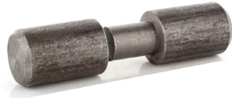
Szczeg.3 Zawias stalowy toczony do bram i furtek Ø40x120mm