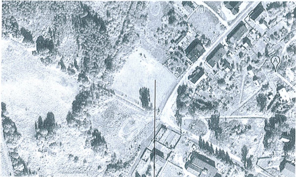
Boisko i plac zabaw w Kościecinie