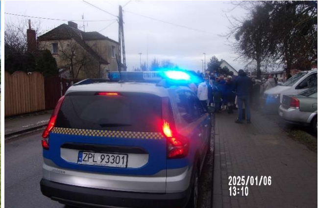
Zabezpieczenie Orszaku Trzech Króli