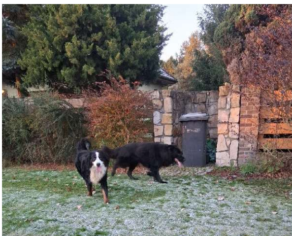
Luzem biegające psy, ustalono właściciela i nałożono mandaty karne.

W wyniku przeprowadzonych czynności stwierdzono 3 przypadki naruszenia obowiązujących przepisów. W związku z tym nałożono 1 mandat karny oraz udzielono 2 pouczenia.