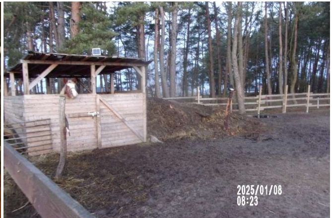
Kontrolę warunków przetrzymywania zwierząt hodowlanych wspólnie z Powiatowym Lekarzem Weterynarii.