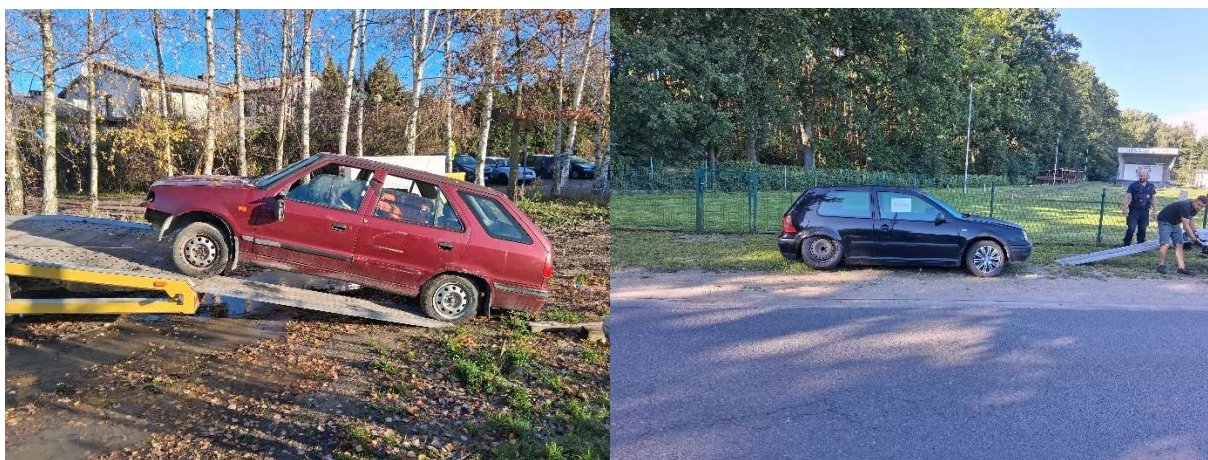
Pojazdy usunięte jako wraki na parking.

Podejmowanie działań zmierzających w pierwszej kolejności do ustalenia właściciela i zobowiązania go do usunięcia pojazdu wynika między innymi z wysokich kosztów związanych z przymusowym usunięciem pojazdu oraz jego przechowywaniem na parkingu strzeżonym przez okres do 6 miesięcy. Koszty te ponosi Gmina i wynoszą średnio około 1 500 zł na jeden pojazd.