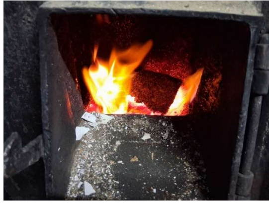
Spalanie pozostałości płyt wiórowych, nałożono 2 mandaty karne.