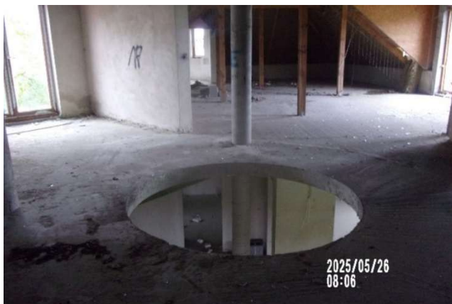
Sprawdzenie niezabezpieczonego pustostanu, powiadomiono Powiatowego Inspektora Nadzoru Budowlanego.

Do Straży Gminnej w Dobrej wpływa szereg innych zgłoszeń mieszkańców. Dotyczą one między innymi miejsc niebezpiecznych, potraconych dzikich zwierząt, uszkodzonych urządzeń. Sprawy takie są przekazywane do odpowiednich organów. W przypadku miejsc niebezpiecznych strażnicy gminni zabezpieczają miejsce, a następnie ustalają osobę lub organ odpowiedzialny za prawidłowe zabezpieczenie miejsca.