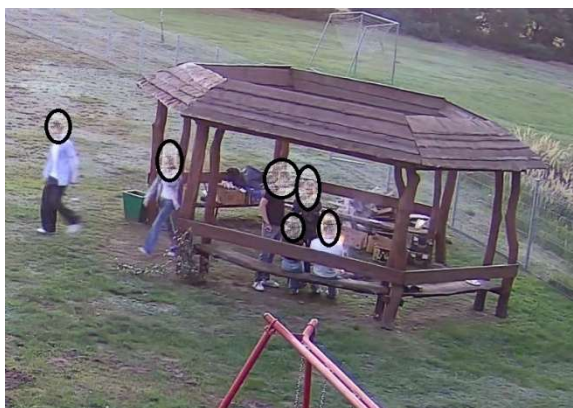
Ustalenie sprawców zniszczenia wiaty, wiatra została naprawiona.

Ponadto Policja czterokrotnie zwracała się do Straży Gminnej o zabezpieczenie nagrań monitoringu na potrzeby prowadzonych czynności służbowych.