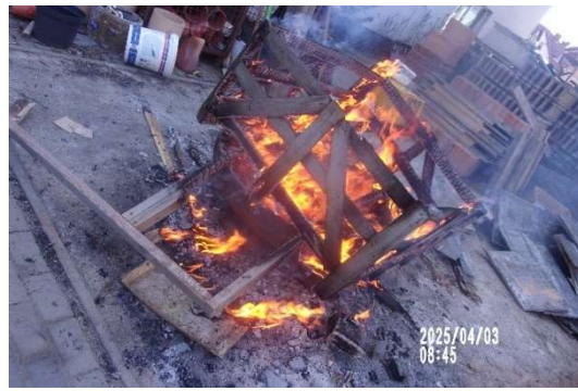
Spalanie odpadów na budowach, nałożono mandaty karne.

Obecne uregulowania prawne zakazują termicznie przekształcać (spalać) odpady poza spalarnią lub współspalarnią odpadów. Taki czyn jest wykroczeniem, za który grozi kara grzywny lub aresztu. A więc tylko gdy wydobywający się dym jest wynikiem spalania odpadów strażnicy gminni mają pełne podstawy prawne do ukarania sprawcy. W innych przypadkach, gdy dym powstaje w wyniku spalania dozwolonego opału brak jest możliwości zakazania spalania, w tym nałożenia mandatu karnego.