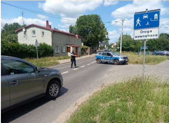
Zabezpieczenie procesji Bożego Ciała.