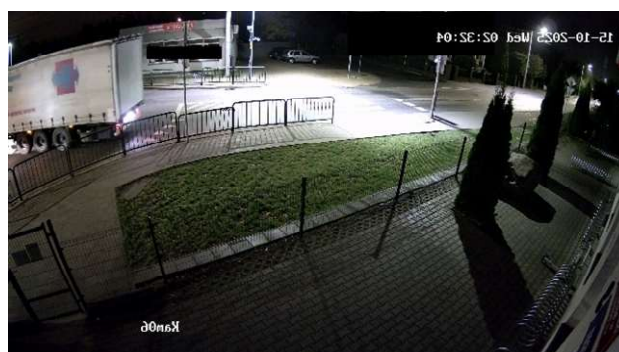
Ustalono pojazd, który zniszczył barierki. Przekazano do Starostwa w Policach.