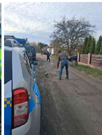
Bardzo duże zabłocenie drogi, nałożono 2 mandaty karne. Zabłocenie przy budowie, nałożono mandat karny.