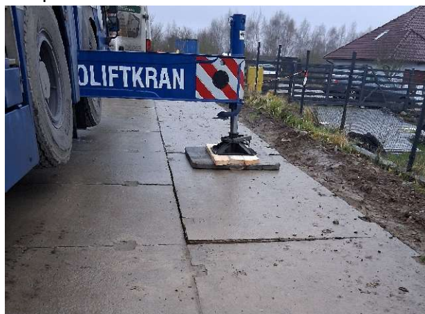
Uszkodzenie płyty drogowej, nałożono mandat karny i powiadomiono Wydział ds. Komunalnych i Inwestycji.