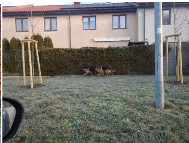
Psy na terenie Szkoły Podstawowej w Mierzynie. Zostały odłowione i przekazane do schroniska. Po ustaleniu właściciela został on ukarany mandatem karnym.