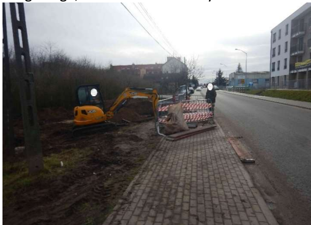
Rozkopanie chodnika bez zezwolenia, nałożono mandat karny i powiadomiono Wydział ds. Komunalnych i Inwestycji.

Przypadki takie miały miejsce głównie na drogach gminnych i chodnikach w obrębie budów. Dodatkowo w tych rejonach często dochodziło do zabłocenia dróg. W analizowanym okresie podjęto łącznie 102 interwencji. W ich wyniku nałożono 11 mandatów karnych oraz zastosowano 19 pouczeń. Za uszkodzenie chodnika lub jezdni nałożono 6 mandatów karnych, udzielono 5 pouczeń. Ponadto podjęto 29 interwencji związanych z samowolnym zwężeniem pasa drogowego, nałożono 3 mandaty karne i udzielono 4 pouczeń.