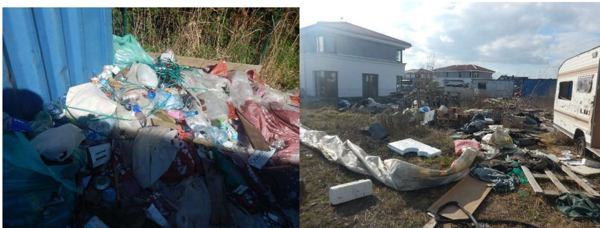
Nieprawidłowe składowanie odpadów na budowach. Luźne śmieci przy silnym wietrze zanieczyszczają tereny sąsiednie. W takich przypadkach nakładano mandaty karne.

Strażnicy gminni z własnej inicjatywy oraz w wyniku licznych zgłoszeń mieszkańców podejmowali liczne kontrole terenów budów związane z nieprawidłowym składowaniem odpadów. Obowiązujące przepisy ustawy o odpadach połączone z ustawą Prawo budowlane i ustawą o utrzymaniu czystości i porządku w gminach wskazują, że odpady powinny być gromadzone w odpowiednich pojemnikach. W wielu przypadkach odpady składowane były bezpośrednio na gruncie. Pomijając, że jest to niezgodne z przepisami, bardzo często luźne śmieci są rozwiewane przez wiatr po okolicznych terenach. Tylko za takie nieprawidłowości ukarano mandatami karnymi łącznie 12 osób. W jednym przypadku skierowano wniosek o ukaranie do sądu.