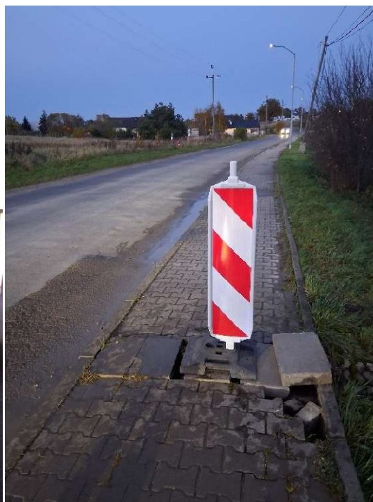
Zabezpieczanie miejsc niebezpiecznych.