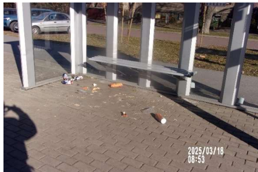
Nieporządek w rejonie obiektu handlowego, nałożono