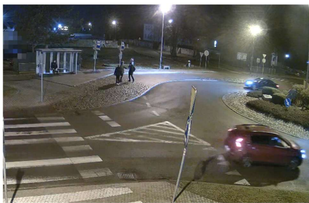
Ustalenie i ukaranie mandatami karnymi sprawców zakłócania porządku publicznego.