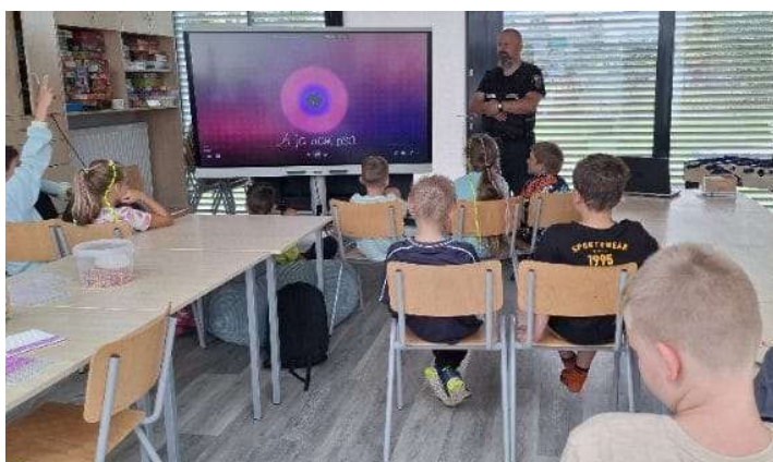
Zajęcia w szkołach i przedszkolach na temat bezpieczeństwa.