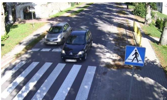
Ustalenie pojazdu wyprzedzającego na przejściu dla pieszych. Przekazano KP w Mierzynie.