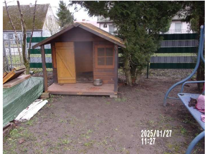
Kontrola warunków przetrzymywania psów.